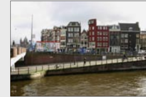
Huidige situatie aan de Prins Hendrikkade, gezien vanaf de overzijde van het Singel

Stadsherstel Amsterdam NV gaat de Haringpakkerstoren herbouwen. Vanwege het 50-jarige bestaan van Stadsherstel in 2006 wil de restaurerende instelling de stad een spectaculair cadeau aanbieden: de herbouw van één van de twee in 1829 gesloopte torens van Hendrick de Keijser. Hiermee krijgt Amsterdam een belangrijk stuk architectuur terug en wordt het stadsgezicht aanzienlijk verfraaid. Op 25 augustus j.l. werd door Stadsherstel een bouwaanvraag ingediend .