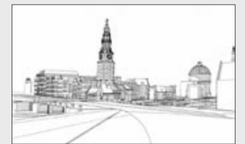
Impressie vanaf straatniveau, vanaf de Prins Hendrikkade