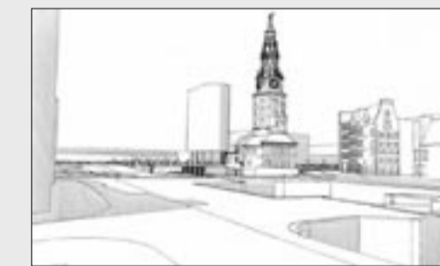
Impressie vanaf straatniveau, vanaf het Singel