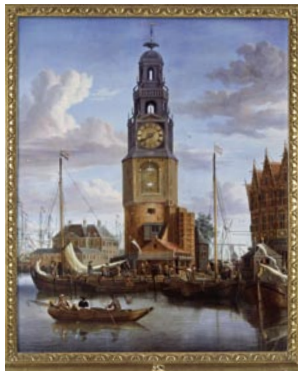
< Storck met de vergulde 18e eeuwse lijst.

De restauratie van het schilderij bestond uit het verwijderen van de oude vernislagen en bood ons tevens de gelegenheid het schilderij aan een nader onderzoek te onderwerpen. Op de eerste plaats kwam onomstotelijk vast te staan dat het uurwerk in de zeventiende eeuw is ingebouwd en het dus geen latere 'verbouwing' betrof. In verband met de afmetingen van het in te bouwen uurwerk, schilderde Jacobus Storck de toren namelijk iets breder dan op grond van de onderlinge verhoudingen zou moeten! De klokkenrestaurator stelde op zijn beurt vast dat het uurwerk uit de zeventiende eeuw stamt met latere toevoegingen en na een grondige schoonmaak is het uurwerk weer teruggebracht in originele staat. De grootste verrassing bracht de lijst. Het paneel zat in een gesneden, vergulde houten achttiende eeuwse lijst. Na verwijdering van deze lijst kwam de originele laat zeventiende eeuwse ebbenhouten lijst te voorschijn, die bovendien puntgaaf was.