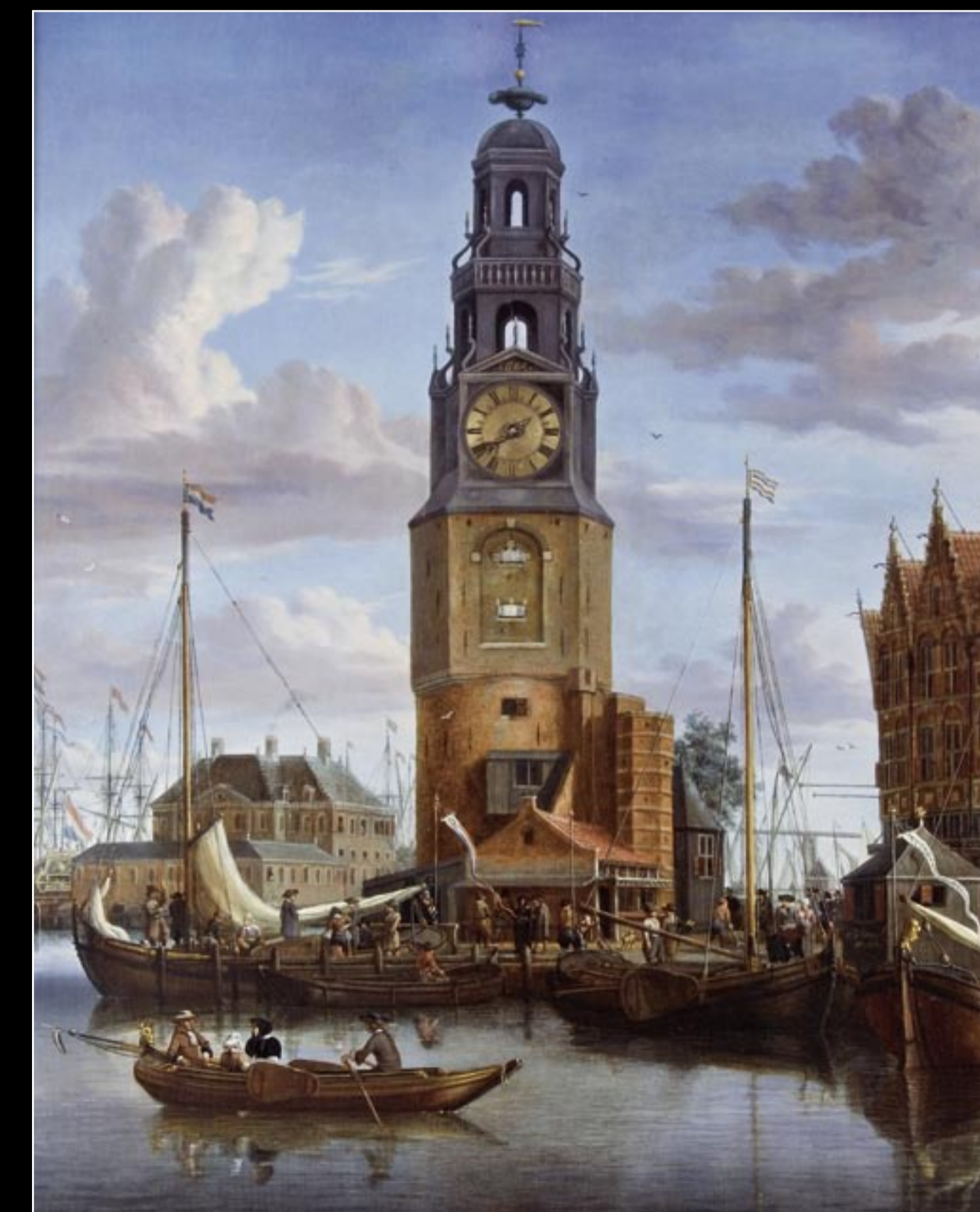
Dutch Old Master Marine Paintings, Drawings & Prints