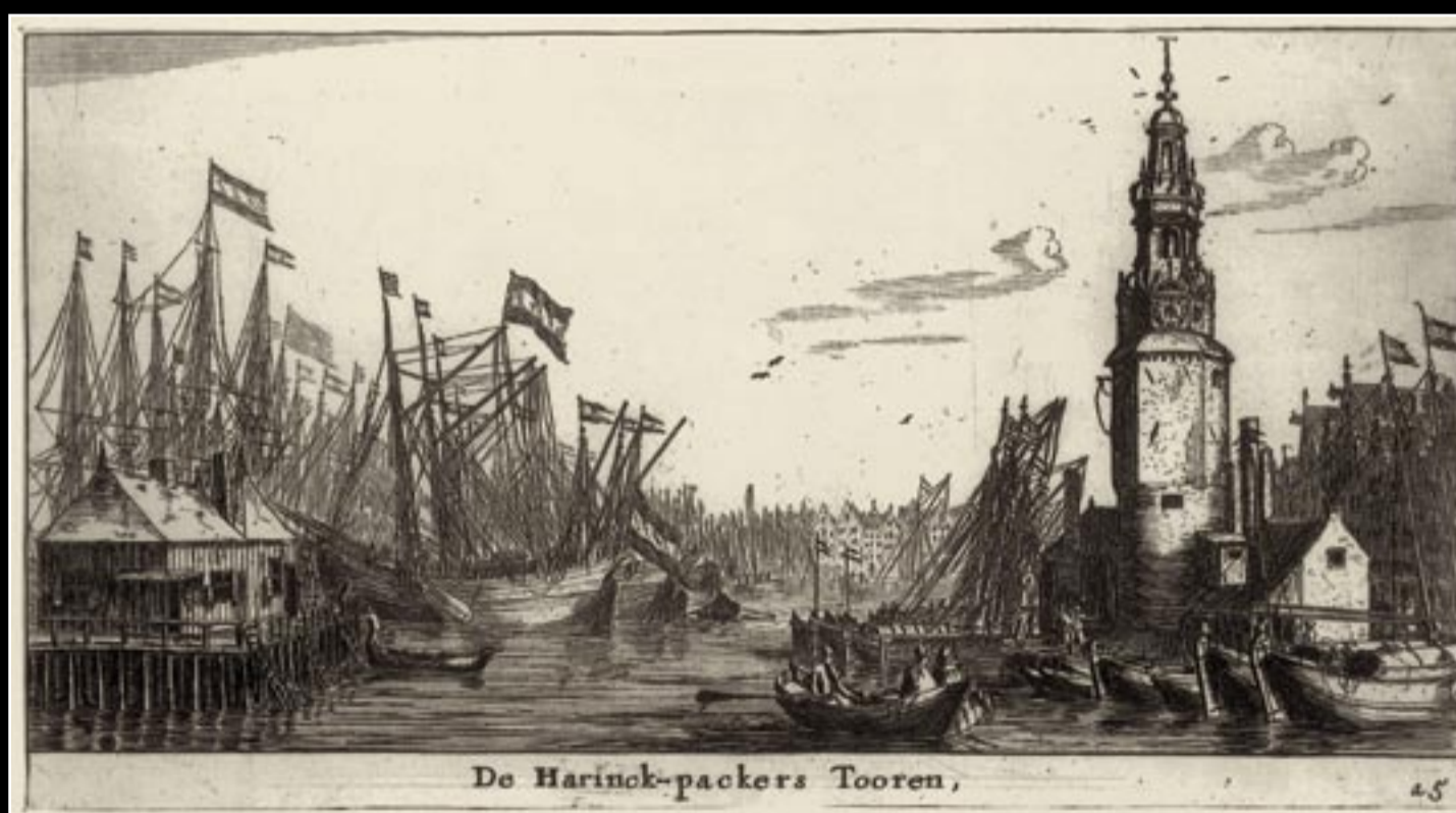
Ets Reinier Nooms, alias Zeeman (Amsterdam 1623 of 1624 - 1664)