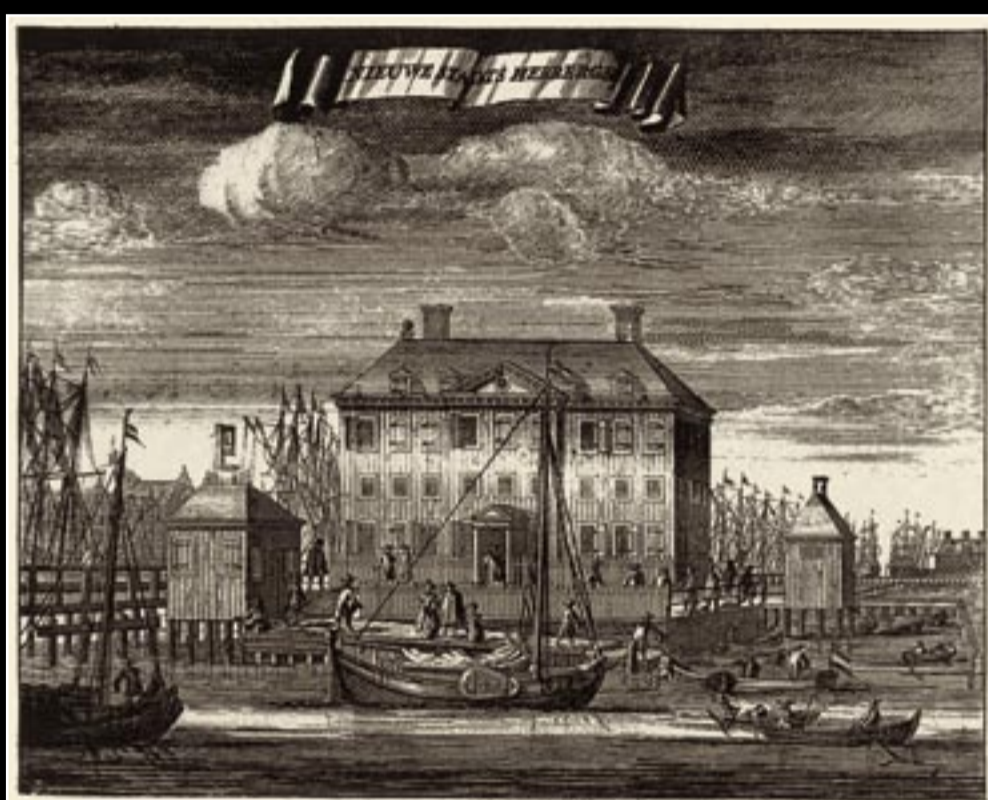
Gravure uit Casparus Commelin's beschrijving van Amsterdam, uitg. 1726