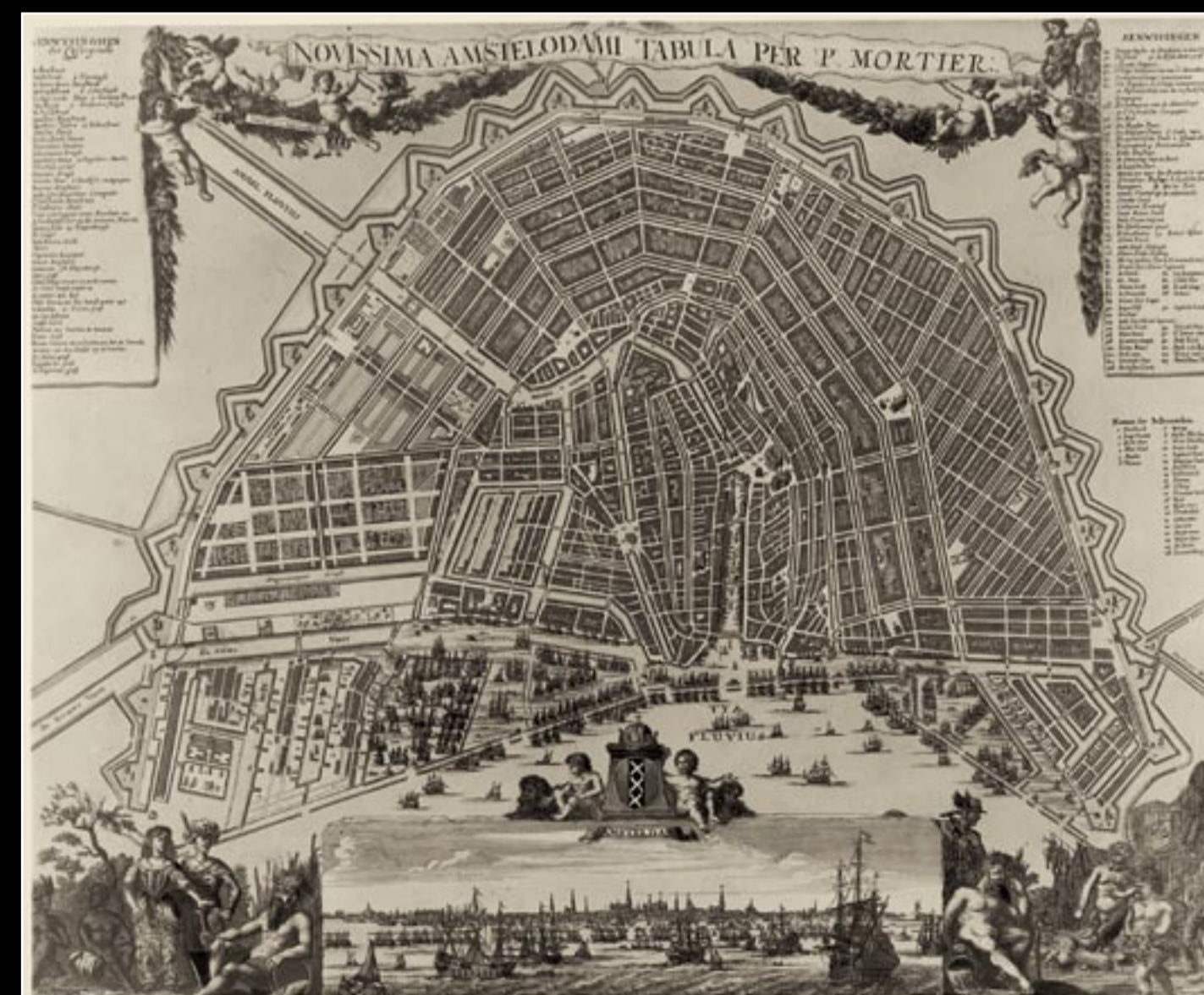
Novissima Amstelodami Tabula per P. Mortier Amsterdam 1692