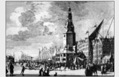
Prent uit de Atlas van Fouquet (winterse impressie met de Haringpakkerstoren, gezien vanaf de overzijde van het Singel)

Met de bouw van de Haringpakkerstoren zal ook het gebied daaromheen volgens Stadsherstel een impuls krijgen. De toren vormt een stedenbouwkundige schakel tussen de weer florerende Haarlemmerbuurt en de momenteel nog kwetsbare kop van de Nieuwendijk. Op de begane grond wordt een grand-café met terras gevestigd en de herinrichting van de openbare ruimte zal het desolate gebied omvormen tot een aangename verblijfsruimte, waardoor een aaneengesloten stukje stad ontstaat. Dankzij de gedetailleerde opmetingstekeningen van Abraham van der Hart uit 1807 en 1813 kan het uiterlijk van de Haringpakkerstoren en de omliggende huisjes tot in detail teruggebracht worden. Architect Paul van Well heeft op basis van deze tekeningen een herbouwplan gemaakt. De onderkant van de toren wil men opbouwen met behulp van moderne technieken, maar de sierlijke torenspits, die Hendrick de Keijser in de 17e eeuw aan het middeleeuwse bolwerk toevoegde, zal op ambachtelijke wijze worden vervaardigd door een zogenaamde 'leerlingenbouwplaats'. Om een bijdrage te leveren aan de instandhouding van het restauratievak zal het ingewikkelde werkstuk van met lood omkleed hout aan de voet van de toren worden gemaakt door ambachtslieden in opleiding. Hun werkzaamheden zullen voor het publiek te volgen zijn, net als bij de bouw van het VOC-schip De Batavia in Lelystad. De herbouw wordt geheel gefinancierd door Stadsherstel – de kosten worden terugverdiend uit de exploitatie.