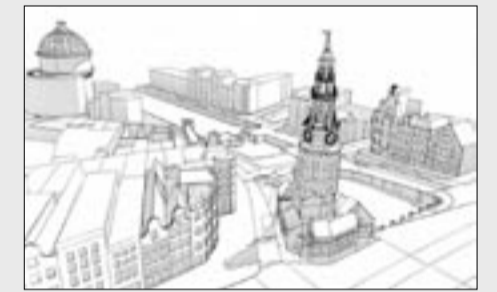
Impressie vanuit de lucht, vanuit het noorden