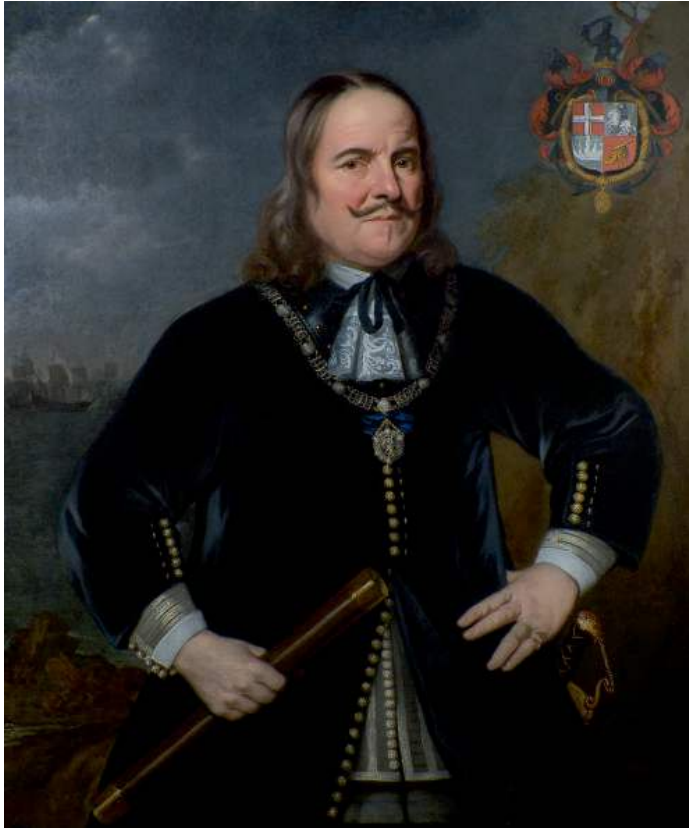
Michiel de Ruyter (1607-1676)