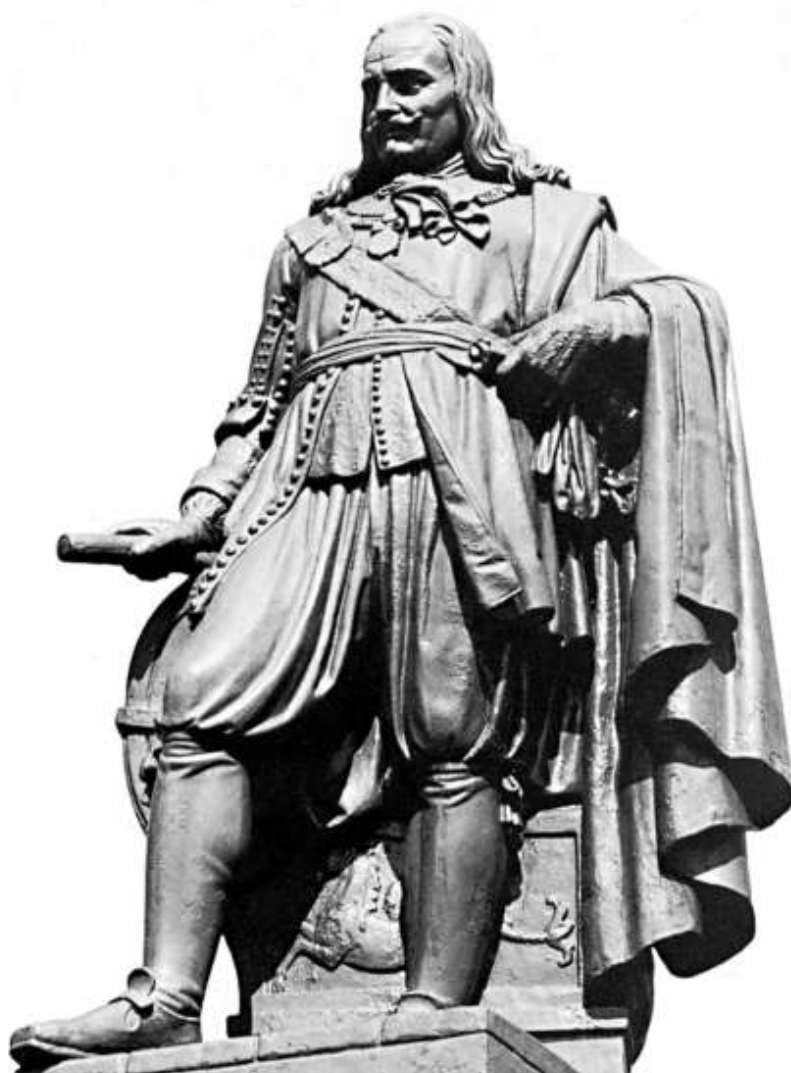
Standbeeld van De Ruyter te Vlissingen