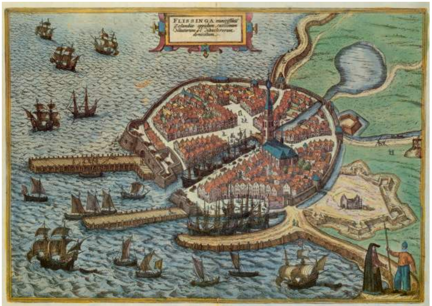
Plattegrond van Vlissingen, 32 x 45 cm. Uitgave Braun-Hogenberg 1576