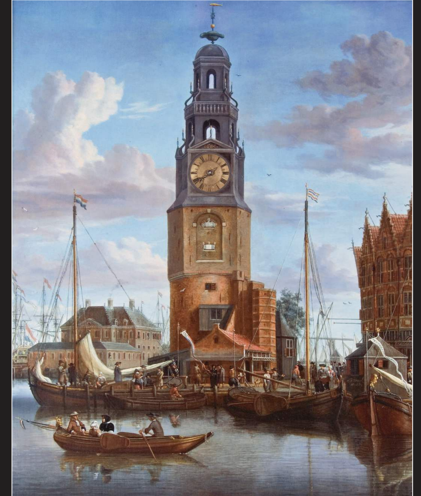
Dutch Old Master Marine Paintings, Drawings & Prints