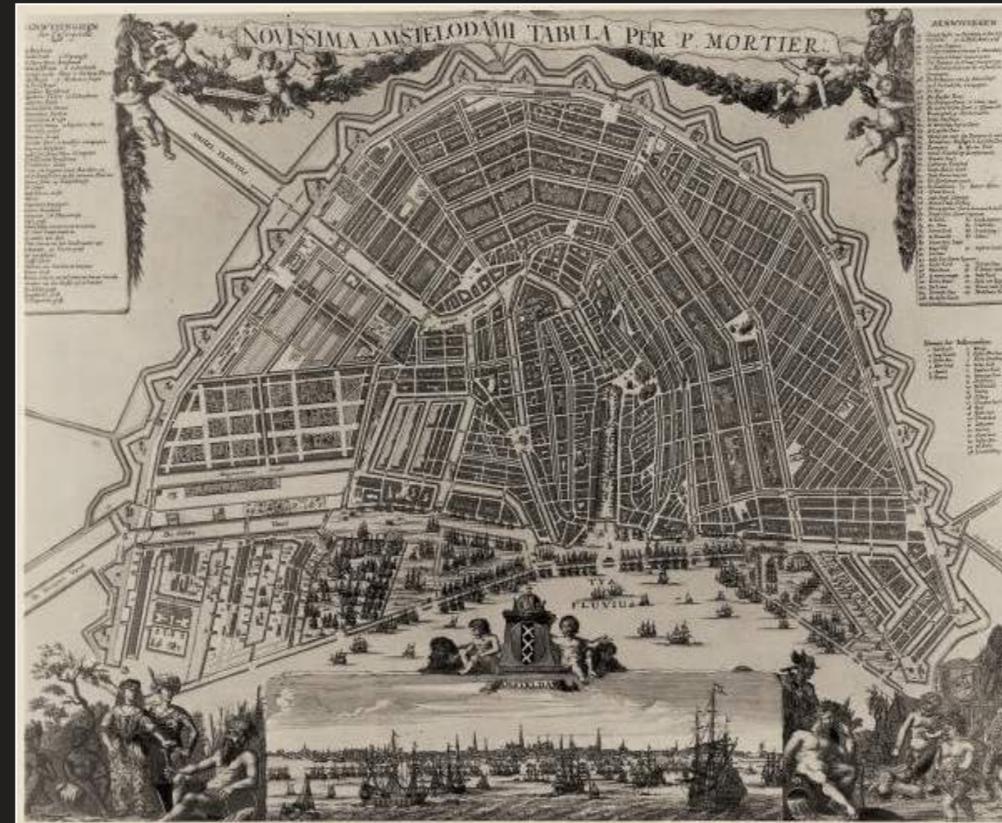
Novissima Amstelodami Tabula per P. Mortier Amsterdam 1692