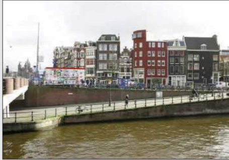
Huidige situatie aan de Prins Hendrikkade, gezien vanaf de overzijde van het Singel

Stadsherstel Amsterdam NV gaat de Haringpakkerstoren herbouwen. Vanwege het 50- jarige bestaan van Stadsherstel in 2006 wil de restaurerende instelling de stad een spectaculair cadeau aanbieden: de herbouw van één van de twee in 1829 gesloopte torens van Hendrick de Keijser. Hiermee krijgt Amsterdam een belangrijk stuk architectuur terug en wordt het stadsgezicht aanzienlijk verfraaid. Op 25 augustus j.l. werd door Stadsherstel een bouwaanvraag ingediend.