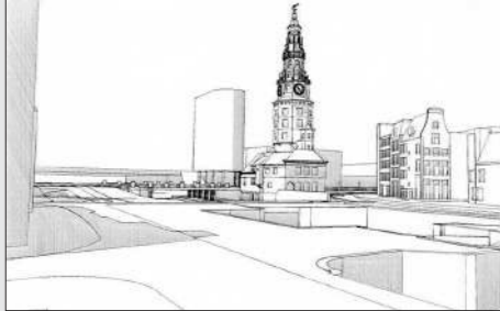
Impressie vanaf straatniveau, vanaf het Singel