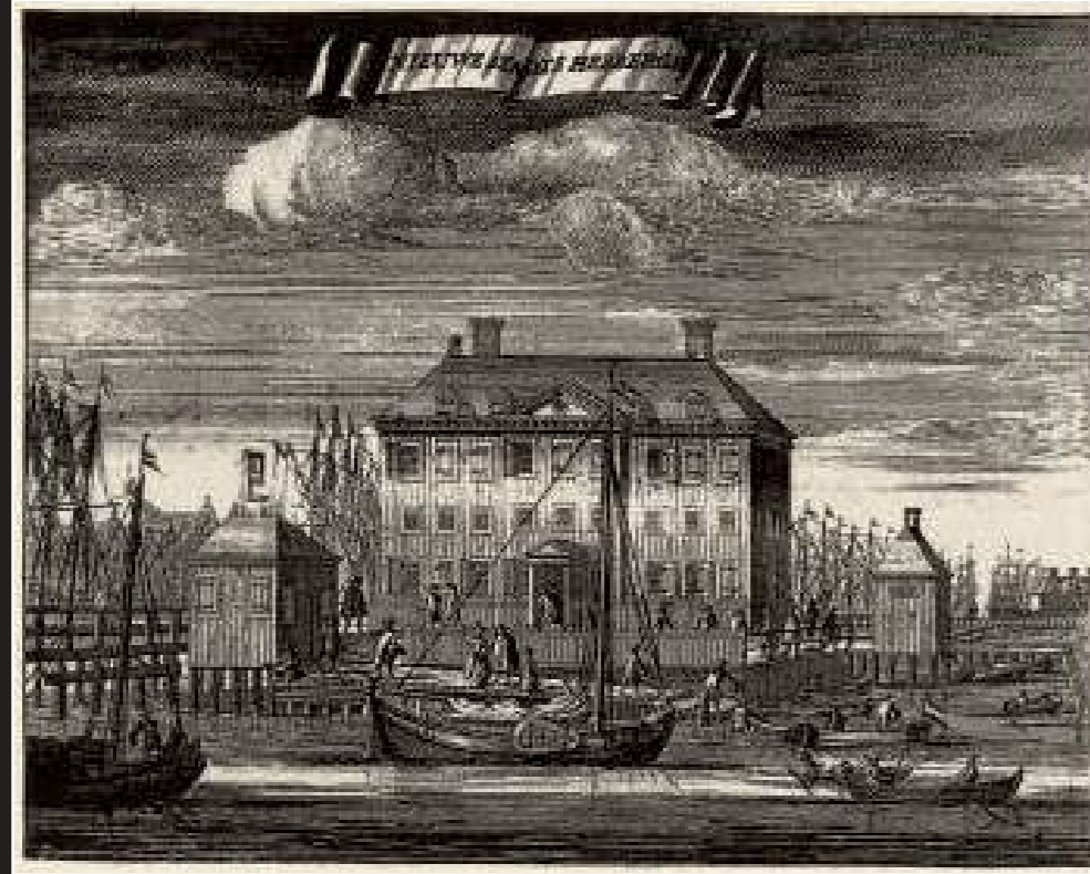
Gravure uit Casparus Commelin's beschrijving van Amsterdam, uitg. 1726