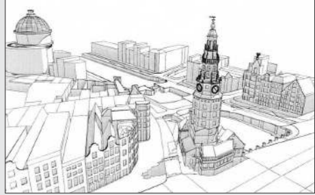
Impressie vanuit de lucht, vanuit het noorden