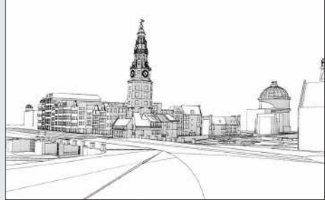
Impressie vanaf straatniveau, vanaf de Prins Hendrikkade