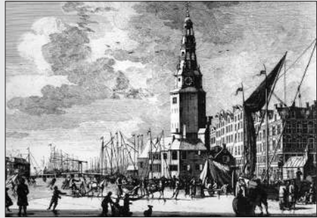
Prent uit de Atlas van Foucquet (winterse impressie met de Haringpakkerstoren, gezien vanaf de overzijde van het Singel)

Met de bouw van de Haringpakkerstoren zal ook het gebied daaromheen volgens Stadsherstel een impuls krijgen. De toren vormt een stedenbouwkundige schakel tussen de weer florerende Haarlemmerbuurt en de momenteel nog kwetsbare kop van de Nieuwendijk. Op de begane grond wordt een grand-café met terras gevestigd en de herinrichting van de openbare ruimte zal het desolate gebied omvormen tot een aangename verblijfsruimte, waardoor een aaneengesloten stukje stad ontstaat. Dankzij de gedetailleerde opmetingstekeningen van Abraham van der Hart uit 1807 en 1813 kan het uiterlijk van de Haringpakkerstoren en de omliggende huisjes tot in detail teruggebracht worden. Architect Paul van Well heeft op basis van deze tekeningen een herbouwplan gemaakt. De onderkant van de toren wil men opbouwen met behulp van moderne technieken, maar de sierlijke torenspits, die Hendrick de Keijser in de 17de eeuw aan het middeleeuwse bolwerk toevoegde, zal op ambachtelijke wijze worden vervaardigd door een zogenaamde ‘leerlingenbouwplaats’. Om een bijdrage te leveren aan de instandhouding van het restauratievak zal het ingewikkelde werkstuk van met lood omkleed hout aan de voet van de toren worden gemaakt door ambachtslieden in opleiding. Hun werkzaamheden zullen voor het publiek te volgen zijn, net als bij de bouw van het VOC-schip De Batavia in Lelystad. De herbouw wordt geheel gefinancierd door Stadsherstel – de kosten worden terugverdiend uit de exploitatie.