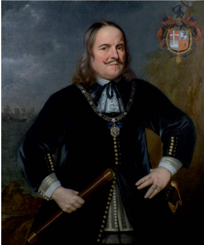
Michiel de Ruyter (1607-1676)