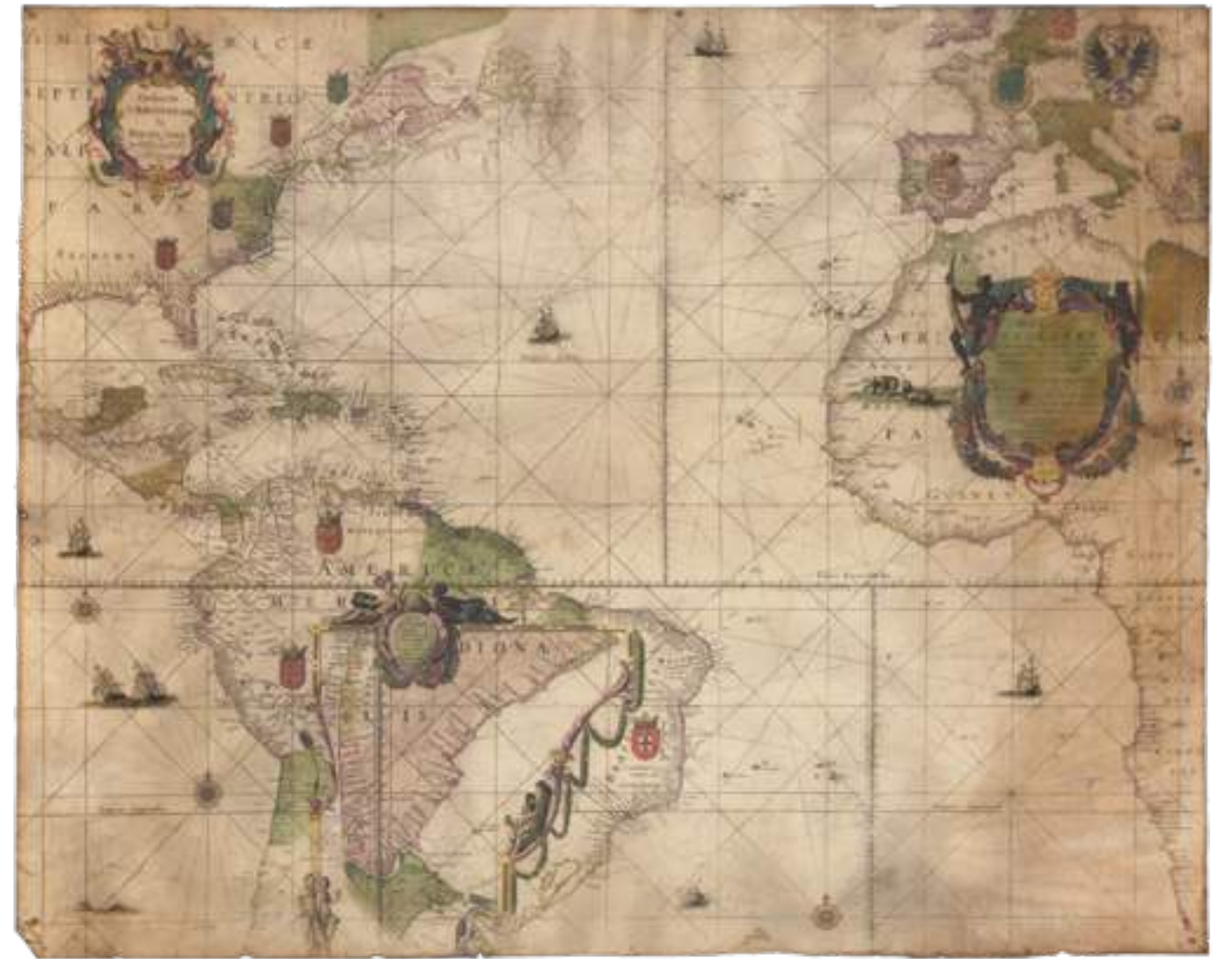
• Links: Johannes Vermeer 'De geograaf' (1669). Olieverf op doek, 53 x 46,6 cm. Gesigneerd middenboven: 'I Vermeer MDCLXVIII' . Collectie Städtisches Kunst- institut, Frankfurt am Main. Op de achterwand is boven de stoel een fragment te zien van de 'Pascaarte van alle de Zecusten van Evropa' die Blaeu in 1621 tekende en uitgaf. De wereldbol op de kast wordt toegeschreven aan de kaartenmaker en uitgever Jodocus Hondius (1563-1612). • Boven: Pieter Goos en Ioannes Loots, West Indische Paskaert (circa 1695). Gemerkt linksboven: 'Gedruckt t'Amsterdam bij Pieter Goos. Op t'Water inde Vergulde Zee spiegel' . Uitgegeven door Ioannes Loots.